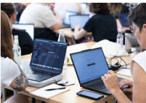
IMPRESSIONEN VOM MITTELBAUWORKSHOP 2025.