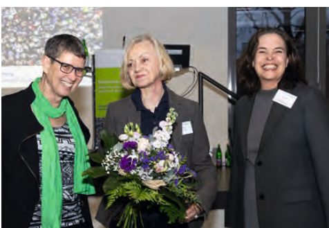
IMPRESSIONEN VON DER JAHRESTAGUNG 2025.